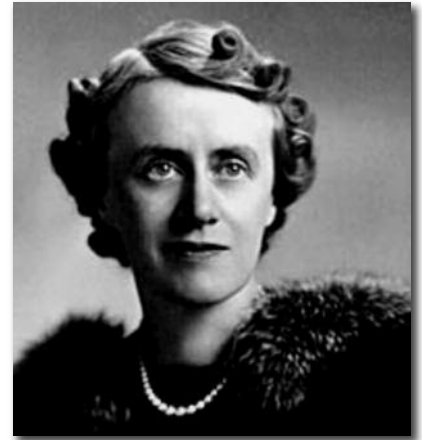
Marie-Thérèse Casgrain, militante pour le droit de vote des femmes

Les choses ont bien tourné et les astronautes ont mis pied sur un autre corps céleste que la Terre le 20 juillet 1969. Neil Alden Armstrong est décédé le 25 août 2012, à l'âge de 82 ans.