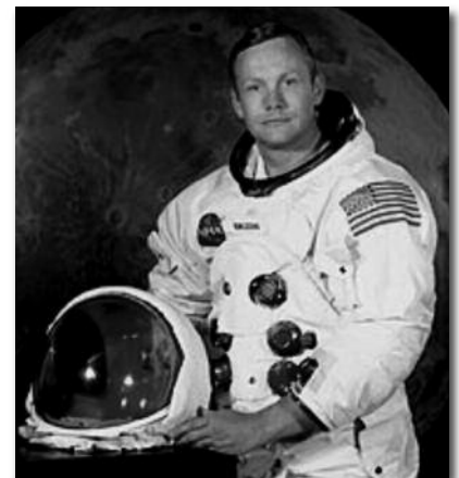
Neil Alden Armstrong, le 1 er juillet 1969

« Visez la lune, et si vous deviez échouer, vous seriez encore parmi les étoiles. » (anonyme)