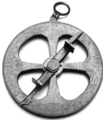
L'astrolabe de Champlain.