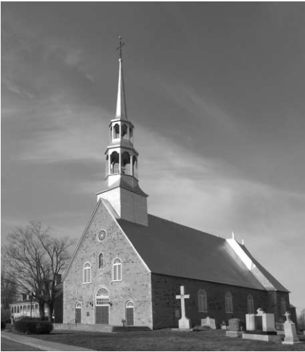
L'Église de L'Acadie.