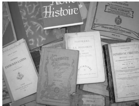
Manuels scolaires appartenants à la SHBMSH .