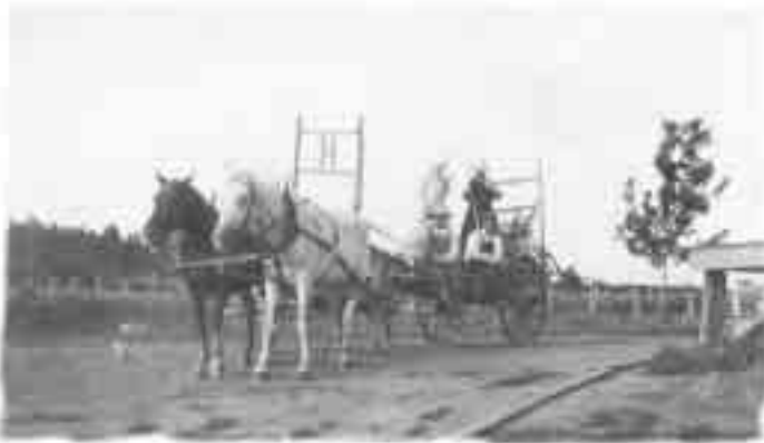
Récolte des foins sur le chemin du Ruisseau Nord.